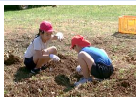
「こうやって掘るんだよ」

先日、11月に植え付けをしたじゃがいもを収穫しました。今年は、大きさは小ぶりでしたが、たくさんのじゃがいもを収穫することができました。マラソン大会で応援にかけつけて下さった皆様にも、感謝の気持ちをこめて、プレゼントしました。