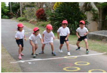
位置について!(1年生)