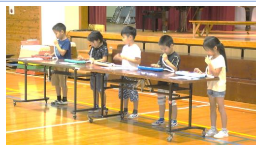
鍵盤ハーモニカが上手に弾けたよ！(1年生)

最後には、日頃からお世話になっている皆様へ、感謝の気持ちを込めて、みんなで育てたネギをプレゼントしました。