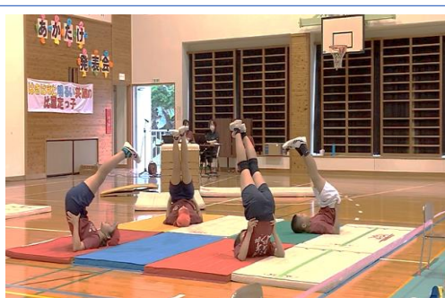
みんなで息を合わせてマット運動(5・6年生)