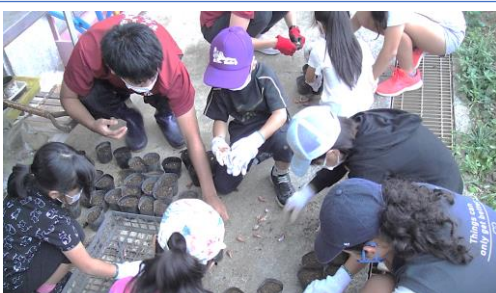
感謝の気持ちを込めてネギの植え付け