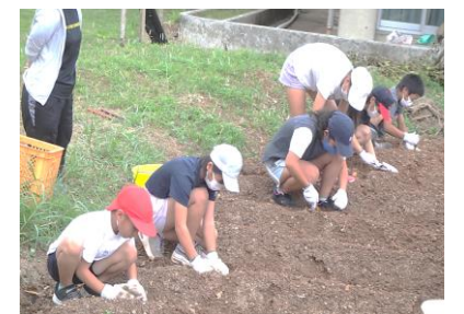
じゃがいもの植え付け

先日、学校ではじゃがいもや玉ねぎ、ほうれんそう、大根などの植え付けを行いました。太陽や大地の栄養をいっぱい吸収し、豊かに実ることを楽しみに、子ども達と共に育てていきたいと思えます。保護者や地域の皆様、今年も大変お世話になりました。どうぞ良い年をお迎え下さい。