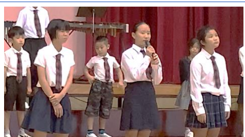
小学校最後のあかたけ発表会 終わりのあいさつ(6年生)